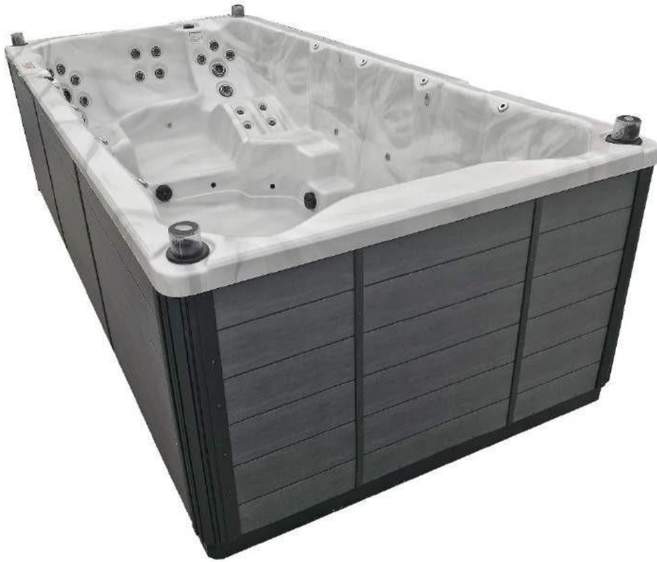
Modèle de jupe présente sur AQUEX 16 (Idem pour AQUEX 12 et 14)